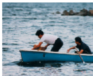
▲ 2箇所のポイントに投入する