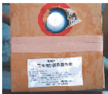
▲ 記憶水：三河湾水質改善の水